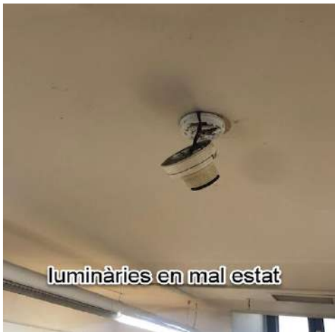
luminàries en mal estat

Tercer.- Luminositat deficient i lluminàries en mal estat amb nivells per sota dels 500 lux.