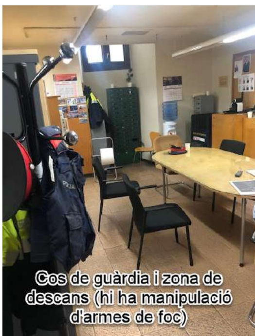
Cos de guàrdia i zona de descans (hi ha manipulació d'armes de foc)