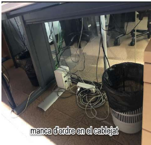
manca d'ordre en el cablejat