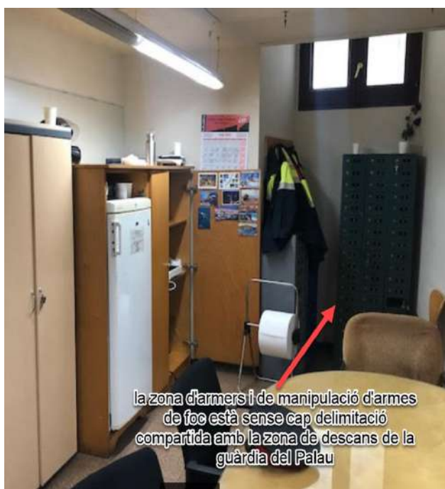
la zona d'armes i de manipulació d'armes de foc està sense cap delimitació compartida amb la zona de descans de la guàrdia del Palau

Especialment sobta que la zona freda (la qual serveix per manipular l'arma) es trobi en la mateixa zona on descansen els efectius policials. Amb aquesta ubicació es pot donar la coincidència que, mentre un efectiu es troba a la zona de descans, n'hi pugui haver un altre manipulant la seva arma.