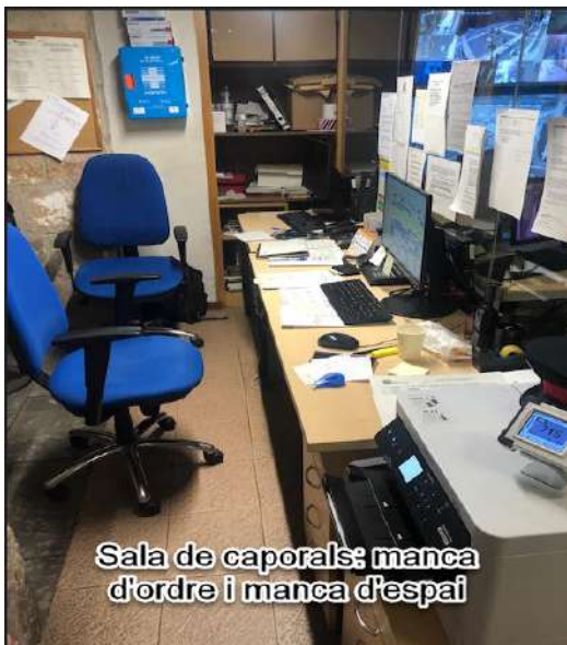
Sala de caporals; manca d'ordre i manca d'espai

Segon.- Manca d'ordre i d'espai per al correcte desenvolupament del servei policial.